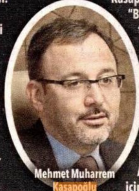
Mehmet Muharrem Kasapoğlu

Gençlik ve Spor Bakanı Mehmet Muharrem Kasapoğlu , Ekonomi Muhabirleri Derneği Yöneticileri ile dün biraraya geldi. Gençlere yönelik projeler ve verdikleri burslara yönelik açıklama yapan Kasapoğlu "Bugün yurtlarımız 700 bin kapasite ile pek çok otel zincirinin önünde bir kapasiteye sahip. Yılda yaklaşık 10 milyar lira kredi ve burs dağıtıyoruz. Ocak ayında öğrenci başına kredi tutarını 650 lira yaptık, her yıl artırmaya çalışıyoruz" dedi.